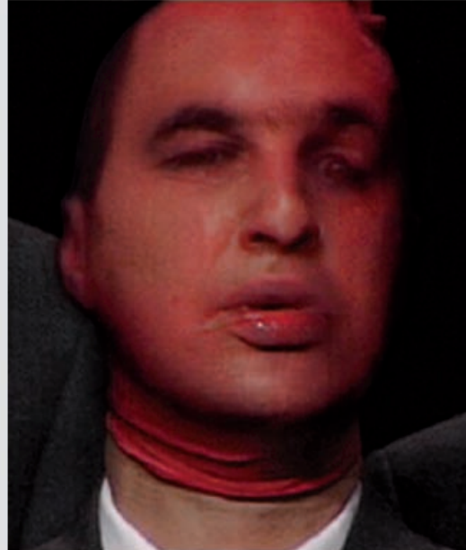
Men in Pink©Sylvie Blocher/Courtesy Monstre Galerie de Roussan

C'est une belle revue, avec une ligne éditoriale tendue, des choix graphiques intéressants, des cartes blanches sur des artistes trop méconnus et bien qu'ouvertement LGBT, elle n'est pas excluante, son positionnement art contemporain et recherche universitaire offre une mise en abîme inédite dans le paysage "culturel" français. Consultable sur le stand mais surtout à collectionner!!!