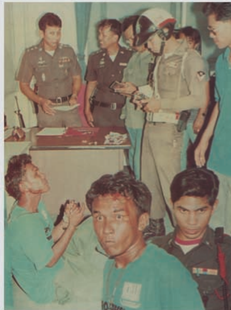
Boyzone©Clarisse Hahn/Courtesy Monstre/Galerie de Roussan

La proposition de la galerie De Roussan, nichée au coeur du 19eme arrondissement de Paris est suffisamment enthousiasmante ( on ne parlera pas du courage des jeunes galeries à s'installer et à promouvoir des projets loin des standards commerciaux actuels) pour qu'on ne passe pas sous silence leur participation sur la foire. Plutôt spécialisée dans le dessin et les oeuvres sur papier, elle a re-invité pour l'occasion la revue Monstre qui a fait l'objet d'une exposition en mai/juin dernier et d'une carte blanche cet été au MAC VAL.